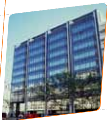
Caixa Geral de Depósitos Local: Av. da República, Lisboa