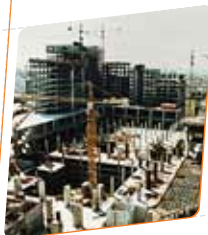
Edifício das Amoreiras Local: Av. Duarte Pacheco, Lisboa