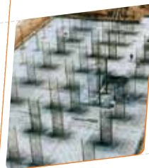
Hotel Olympus-Vilamoura Local: Vilamoura